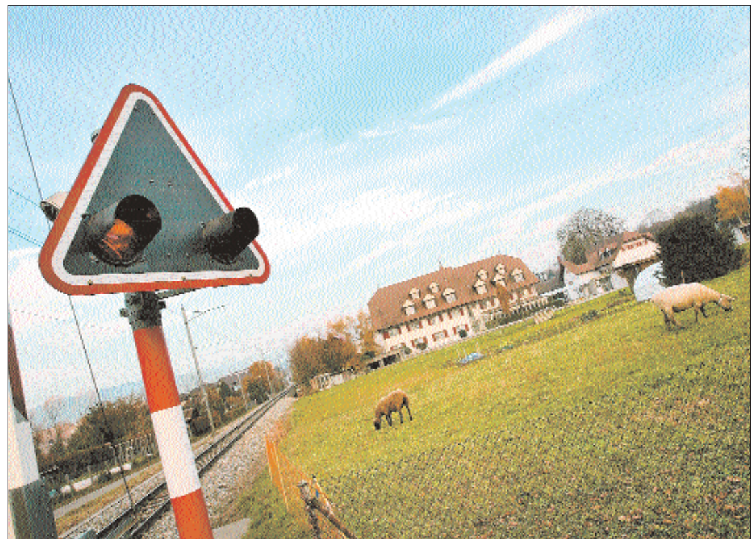
Das Schlössli in Ipsach: Die neue Geschäftsführerin soll das Vertrauen wieder herstellen und der Besitzer hegt Ausbaupläne auf seinem Terrain.

Trotz Führungswechsel profitiere das Schlössli noch vom Expo-Effekt, schätzt Weber: «Es gibt Gäste, die wiederkommen, und jetzt die schöne Gegend sehen wollen, für die ihnen an der Expo die Zeit fehlte. Ich bin überzeugt, dass man hier noch viel mehr machen könnte.»